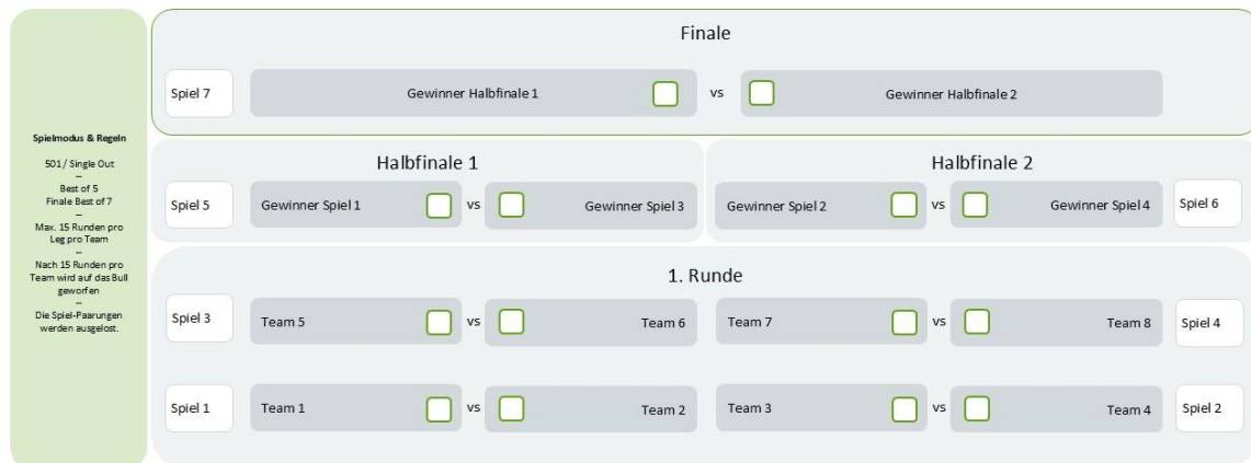
Abbildung 3: Spielplan S-Bahn Darts Open