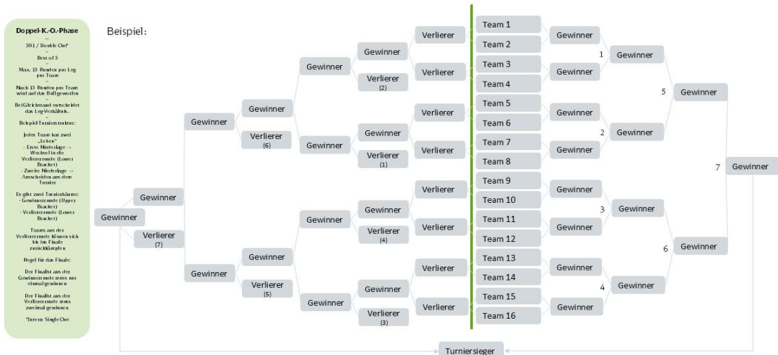
Abbildung 2: Spielplan Qualifikationsturniere