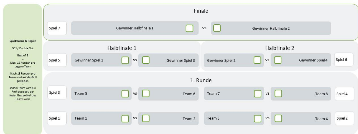
Abbildung 3: Spielplan S-Bahn Darts Open