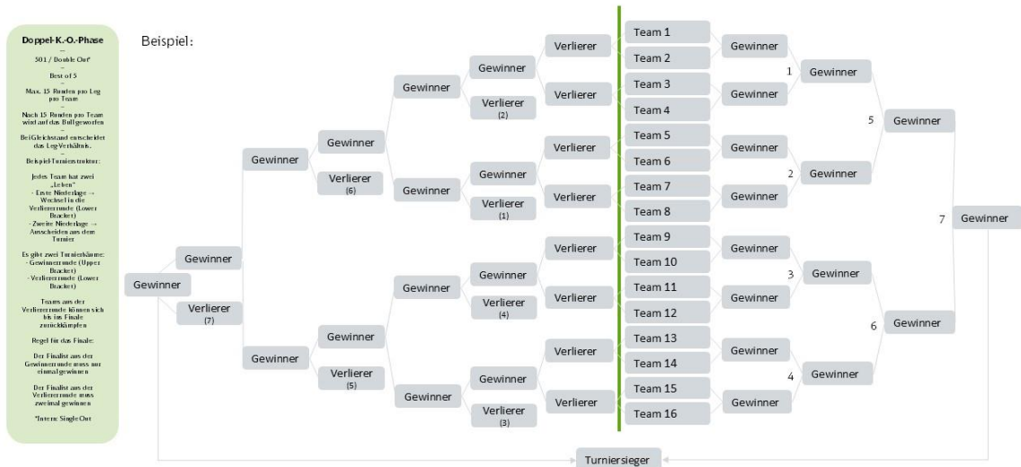
Abbildung 2: Spielplan Qualifikationsturniere